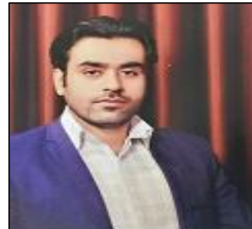
مضمون توسعه کارافرینی